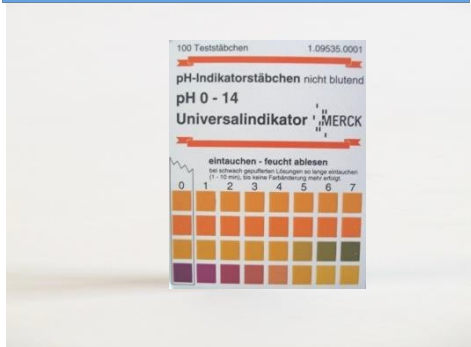
pH-value test stripes measure range pH 0 - 14