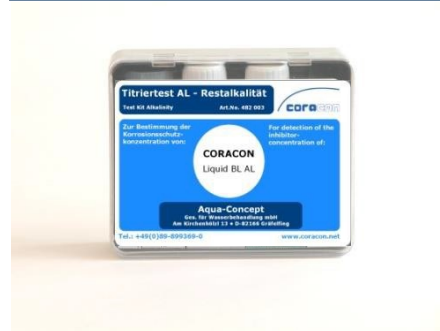
Corrosion titration box alcalinity test BL AL