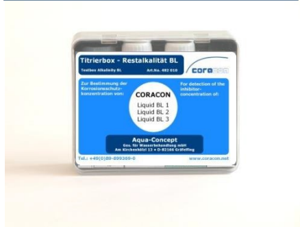
Corrosion titration box alcalinity test BL 1, BL 2, BL 3