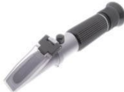
Corrosion tester refractometer for inhibitors