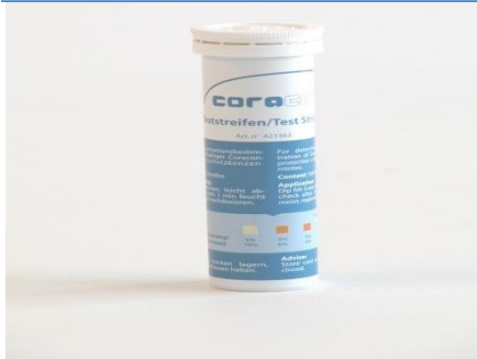
Corrosion test stripes nitrite test BL 1, BL AL